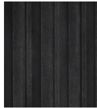
BURNT CEDAR - MCB320R