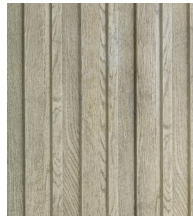
SMOKED OAK - MCB320D