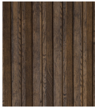
ANTIQUE OAK - MCB320A