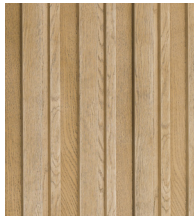
GOLDEN OAK - MCB320G