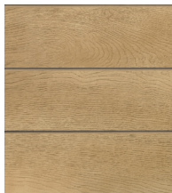
GOLDEN OAK - MCG360G