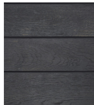
BURNT CEDAR - MCG360R