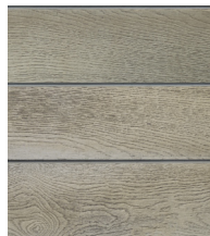
SMOKED OAK - MCG360D